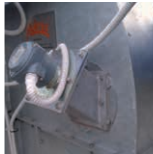
ENG. Anti-choke on head FRA. Anti-engorgement sur tête ITA. Antintasamento sulla testa