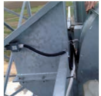
ENG. Explosion prevention chimney FRA. Conduit anti-explosion ITA. Camino antiscoppio