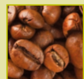
coffee beans café caffè