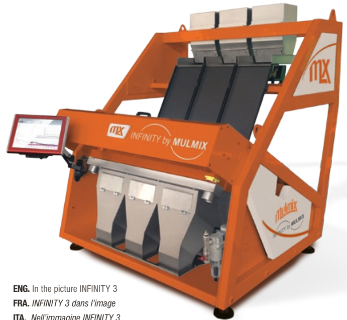
ENG. In the picture INFINITY 3 FRA. INFINITY 3 dans l'image ITA. Nell'immagine INFINITY 3

Tutti i componenti elettrici e meccanici sono ordinabili e disponibili in qualunque momento, ma sono anche di facile reperimento in qualsiasi parte del mondo contattando direttamente i subfornitori.