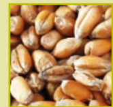
wheat blé grano