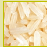
rice riz riso