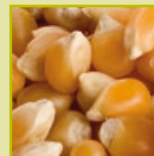
corn maïs mais